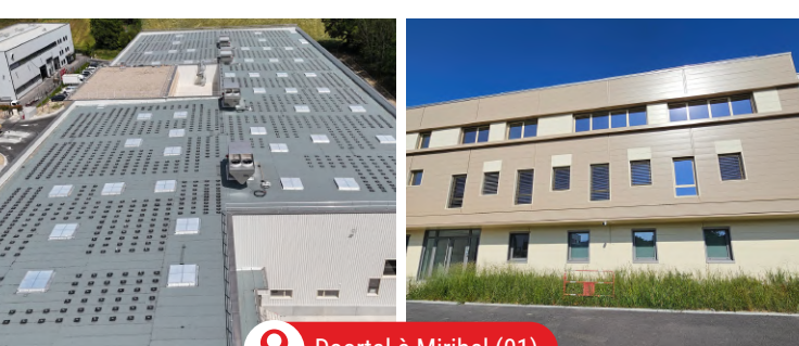
Doortal à Miribel (01)