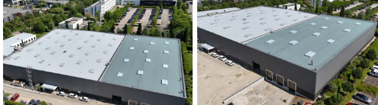
Mileway à Saint-Priest (69)

Nous intégrons les normes de sécurité et réglementations en vigueur afin de garantir des installations conformes, fiables et durables.